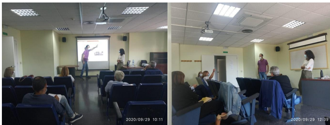
Fotografies preses durant la reunió formativa i el posterior taller de diagnòstic

Aquesta dinàmica es va centrar en la detecció de necessitats i problemàtiques, com un avançament de l'objectiu d'abordar els actius de salut en una segona sessió que estava ja plantejada per als pròxims mesos. Va ser una sessió molt propositiva en la qual es remarcaren algunes oportunitats d'actuació al municipi i es generaren sinergies entre determinats sectors tècnics (com ara Cultura) i el Centre de Salut. A continuació, es detallen els resultats d'aquesta sessió.